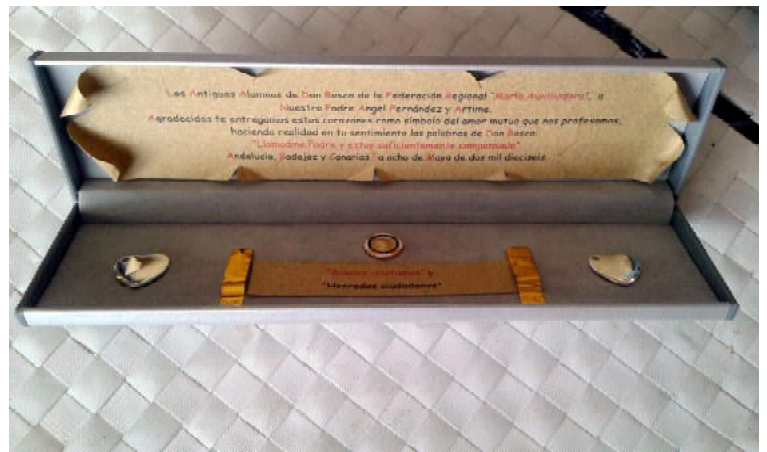
SEVILLA: VISITARECTOR MAYOR