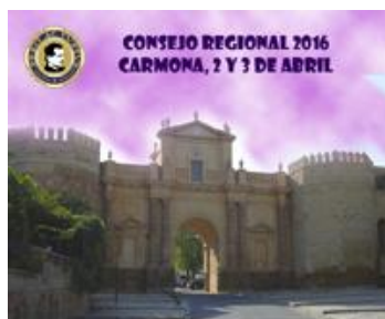
CONSEJO REGIONAL 2016 Cartel convocatoria