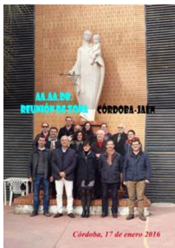
CÓRDOBA Reunión asociaciones