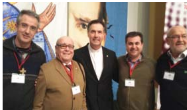
ROMA Jornadas Espiritualidad Salesiana