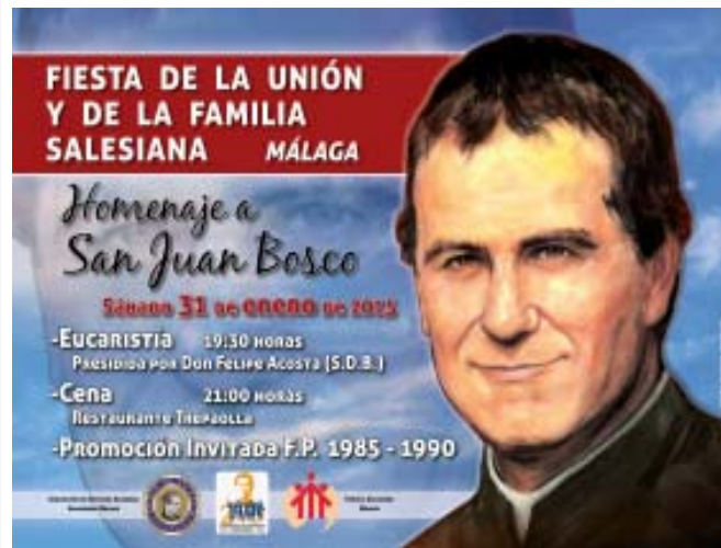
MÁLAGA Cartel Fiesta de la Unión